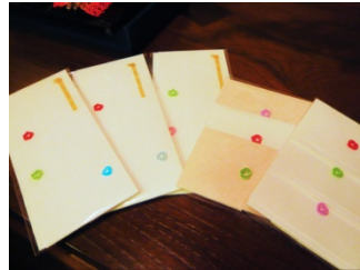
あわじ結びを貼り付けるだけでこんなにかわいいぽち袋ができます

水引と格闘した後は兼六園の散策。雪の兼六園、なかなかおつですなあ！雪景色って見るのはいいけど、足元は悲惨な状態になることがほとんど。そんな中、今日のお天気は最高！足元には雪がないけど、園内の木々はきれいに雪化粧してます。冬の兼六園は閉園時間が早いので、駆け足で園内を見てまわり、金沢城へ。なまこ塀と鉛瓦の上には白い雪。