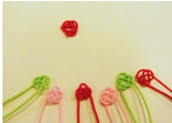
上が先生作。私もなかなか上手いと思うんだけど・・・

私など指が真っ赤になりました。今回は基本「あわじ結び」を習いました。これでラッピング用のし紙を作ります。なぜって？それは内緒！