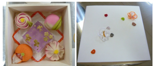
出来上がった和菓子たち（左）とラッピング 完了の和菓子ボックス（右）

自分の作った3つと先生が作った2つ（みかんと椿）を 特製の木箱につめたらようやく完成！ これを二股和紙の包装紙にくるんで、昨日作った水引の ついたおのしをつけて、私だけの「和菓子ボックス」 の出来上がり！「う～ん・・・上出来！」