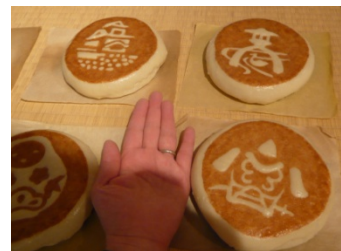
この大きさがたまらん！

館内の菓子ミュージアムで金沢の伝統菓子の紹介と銘店の味をショッピング。私の大好物「焼まん」みい～つけ！