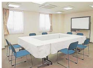
小会議室「鞍月」 29m 2 (9坪)