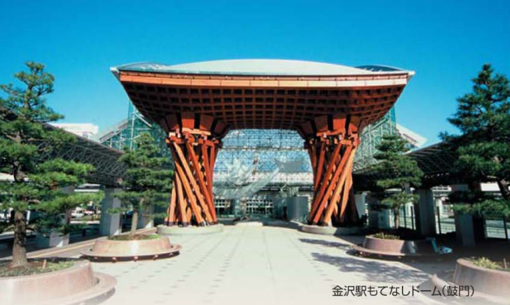
金沢駅もてなしドーム(鼓門)