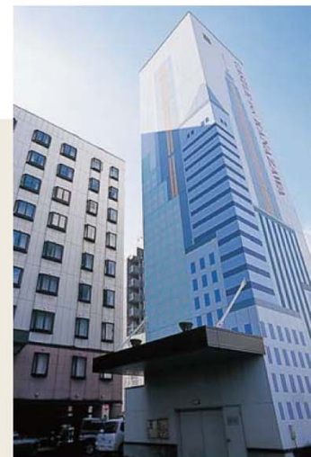
パーキングタワー