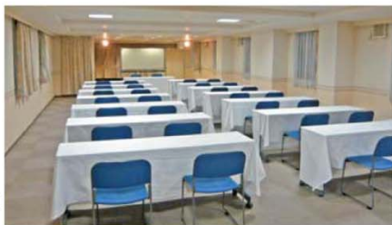
大会議室「辰巳」 111m 2 (33坪)

会議はもちろん、さまざまな講演会、講習会、パーティ、各種会合・会食など多目的にご利用いただけます。人数・規模に応じ、最適な環境をご提供いたします。