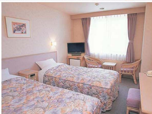
南ウイング客室(スタンダードツインタイプ)