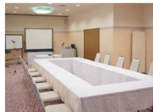
多目的ホール「この花」 55m 2 (17坪)